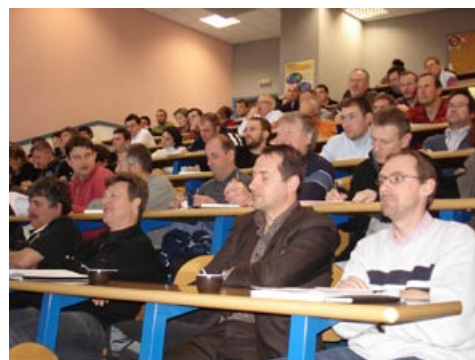
Assemblée des acteurs 2008

Une fois par an, le CRAIG donne la parole aux utilisateurs sur un projet, une thématique, un partenariat... Très appréciées, ces journées rassemblent une centaine de participants.