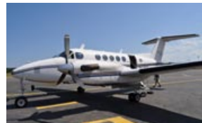
Beechcraft utilisé pour l'acquisition des photos aériennes