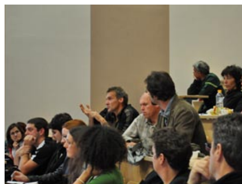
Journée technique IRC 2009

Plusieurs fois par an, le CRAIG organise des journées techniques ouvertes à tous. Ces journées ont pour vocation d'approfondir un sujet d'actualité ou de fond sur des aspects techniques, méthodologiques ou juridiques. Le CRAIG invite différents experts et spécialistes reconnus selon le thème défini.