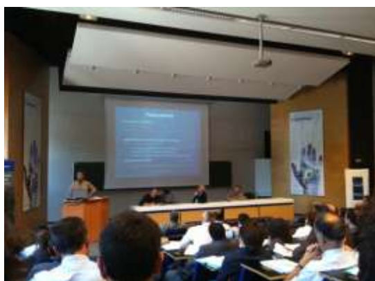
5 èmes Rencontres des Dynamiques Régionales AFIGéO à Orléans

L'Association Française pour l'Information Géographique a lancé les « Rencontres des Dynamiques Régionales » pour permettre aux plates-formes locales de mutualisation de données géographiques de se rencontrer pour échanger leurs expériences et progresser collectivement sur des thèmes partagés. Organisée une fois par an, elles rassemblent sur deux jours, l'ensemble des représentants et partenaires de plateformes d'animation territoriale autour d'un programme construit sur des thèmes d'actualités. Par principe elles sont co-organisées par une structure locale et par AFIGéO.