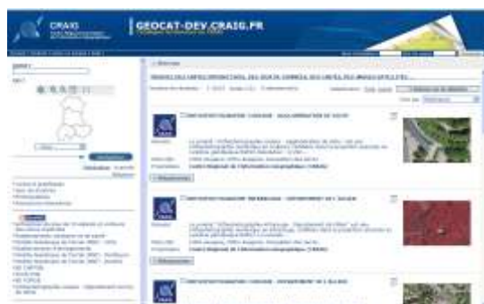
Interface du catalogue de données (Illustration : CRAIG)

Cet outil a pour vocation de recenser et de décrire toutes les données géographiques disponibles sur la région auvergne.