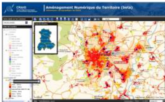
Visionneuse cartographique – Couverture de services (France Telecom) (Illustration : CRAIG)

Afin d'alimenter la concertation et la coopération locale sur l'aménagement numérique du territoire (ANT), la disponibilité de systèmes d'information géographique (SIG) sur les infrastructures de réseaux existantes, sur leur disponibilité et sur la couverture en services numérique apparaît essentielle. Dans l'élaboration des projets, ces informations permettront également de réduire les coûts et d'optimiser les investissements en relation avec le Schéma Directeur Aménagement Numérique du territoire (SDAN) et le Schéma d'ingénierie Fibre optique de l'Auvergne.