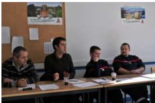
Les représentants des SDIS de la Haute-Loire et du Cantal

Dans ce cadre, une réflexion a été engagée avec les SDIS pour étudier dans quelles mesures ils pourraient contribuer à améliorer de manière significative la qualité des données géographiques disponibles sur le territoire auvergnat