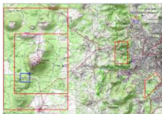
Zone d'exécution du levé LIDAR (Illustration : CRAIG)

La technologie Lidar utilise les propriétés optiques d'une onde laser. Un avion équipé d'un laser envoie une onde lumineuse en direction du sol, en retour le laser mesure et enregistre le faisceau réfléchi. La distance entre le laser et le sol (ou un obstacle) est donnée par la mesure du délai entre l'impulsion et la détection du signal réfléchi.