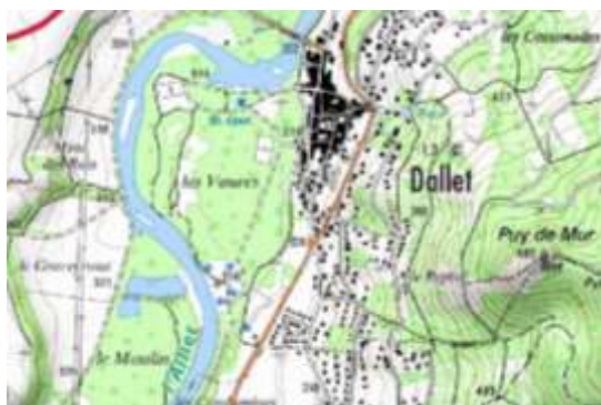
Extrait de SCAN25® de l'IGN sur la commune de Dallet (Puy-de-Dôme)

Afin de constituer les premières composantes du référentiel géographique Auvergnat, le CRAIG s'est rapproché, après avoir recensé les besoins auprès des futurs utilisateurs, de l'IGN pour acquérir les bases de données SCAN25® et BDCARTO® à l'échelle de la région Auvergne.