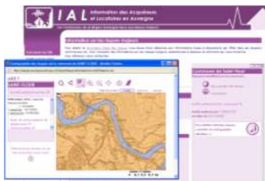
Interface du site d'Information des Acquéreurs et Locataires (Illustration : CRAIG)

Par ailleurs, le CRAIG a permis de répondre à plus de 250 questions postées sur la boîte email du CRAIG.