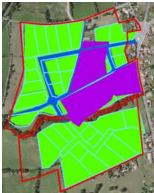
Comparaison des contours de zones d'activités de sources différentes (Illustration : CRAIG)

La Région Auvergne travaille au déploiement d'un réseau de fibre optique pour l'accès au très haut débit des pôles d'entreprise/zones d'activité de la région. Ce développement doit permettre de développer l'attractivité de ces zones.