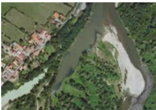
Extrait d'orthophotographie sur la rivière Allier (Puy-de-Dôme)

Depuis le mois de juillet 2010, le CRAIG met à disposition des acteurs publics de la région sur son site ( http://www.craig.fr ) de nouvelles vues aériennes des départements de l'Allier et du Puy de Dôme. Ces données peuvent être utilisées par les services publics dans le cadre de leurs missions et consultées par tous les internautes.