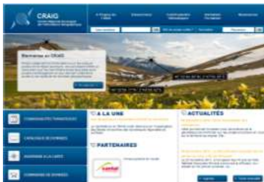
Visuel de la future page d'accueil du site internet (Illustration : CRAIG)

Pour répondre au mieux aux besoins des utilisateurs le CRAIG a engagé en 2009 une refonte de son site internet. Le futur site s'appuiera sur l'outil de gestion de contenu Drupal ( http://drupalfr.org/ ).