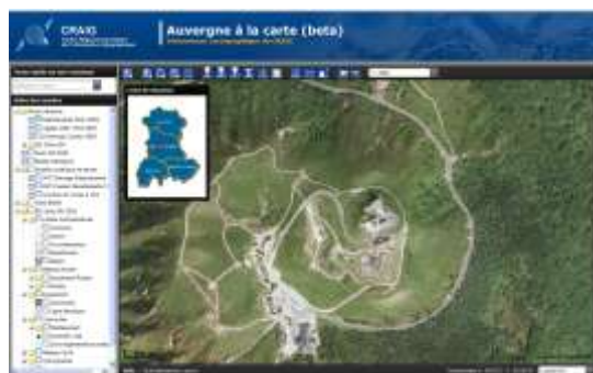
Visionneuse cartographique du CRAIG « Auvergne à la carte » (Illustration : CRAIG)

La mise en ligne de cet outil, offre à chacun la possibilité d'accéder à de nombreuses données géographiques concernant l'ensemble de la région et de mieux connaître le territoire.