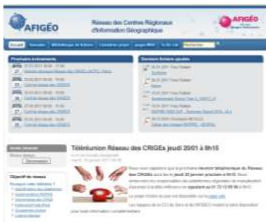
Réseau des Centres Régionaux d'Information Géographique - Extranet (Illustration : CRAIG)

Les 5 èmes rencontres des dynamiques régionales en information géographique organisées par l'Association Française pour l'Information Géographique (AFIGÉO) au mois de juin 2010 à Orléans (45) ont montré :